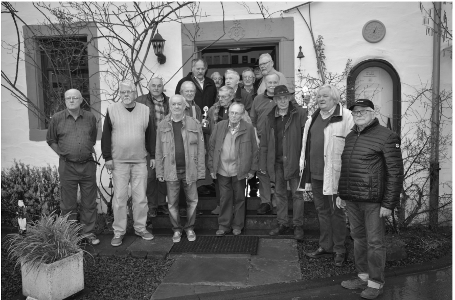
Die Teilnehmer der diesjährigen Meisterschaft