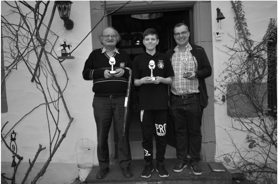
Die Sieger 2019 mit ihren begehrten Trophäen

Zum Beginn des Jahres am 06. Januar richteten wir unser Zwei-Königsturnier in der Hasenmühle aus. Die Besonderheit bei diesem 7-rundigen Schnellschach-Turnier ist, das nur Schachfreunde unter 1500 DWZ mitspielen dürfen. Diese Veranstaltung bietet auch Hobbyspielern eine gute Gelegenheit einmal Turnierluft zu schnuppern. 13 Spieler aus nah und fern kämpften um die 3 begehrten „Siegesgöttinnen“, die es als Pokale gab.